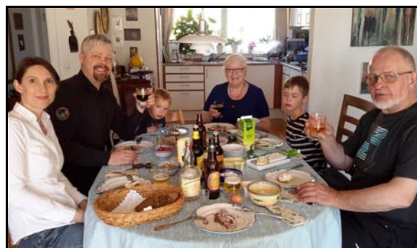
Samlet ved frokost-bordet, når der er besøg fra Norge.