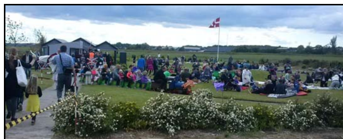
Skt. Hans i Modelparken er årets tilløbsstykke.