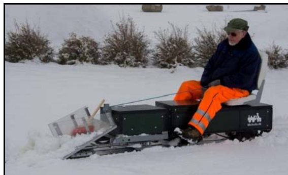
Michael rydder sne. Se link til filmen på Youtube.