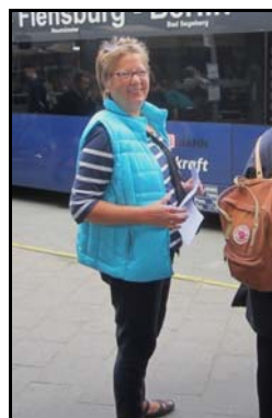
Anne kom ud på en ekstraordinær tur til Danmark