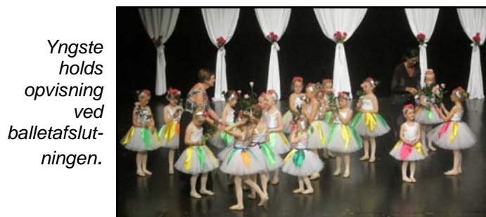
Yngste holds opvisning ved balletafslutningen.