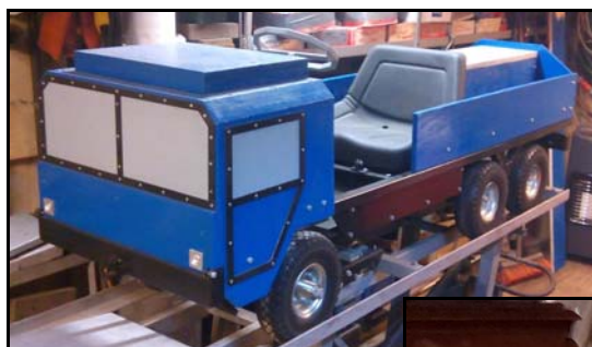
Vinterens store projekt, en lastbil i børnebørn størrelse.