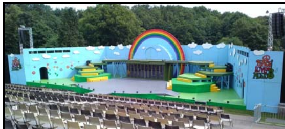
Flot sceneopbygning til "Hair".